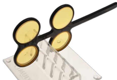
09037 AMD-Comfort dobbelt test oval Flirp

En oval flirp med plano AMD Comfort linser, 1 par AMD-I og 1 par AMD-II.