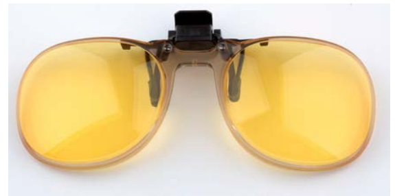
09006 AMD-Comfort test clip-on Flip-Up med rand