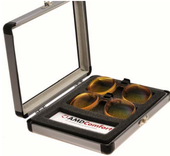
09050 AMD-Comfort test box

2 stk. store AMD Comfort flip-ups (AMD-I og AMD-II) alt samlet i en box.