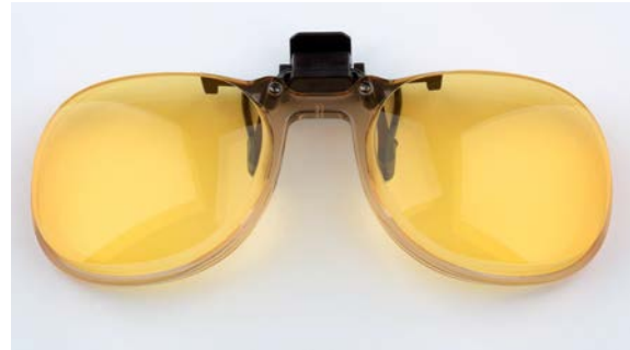
09003 AMD-Comfort test clip-on Flip-Up med rand

Stor Flip-up med plane AMD-Comfort linser. Fås med AMD-I og AMD-II.