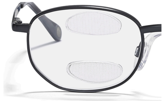
ML Peli Prism PeliSeg med dobbelt segment